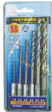
● 六角柄：6.35mm K 含鈦