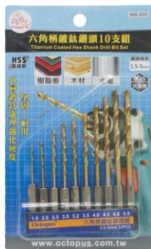
● 六角柄：6.35mm J 鍍鈦